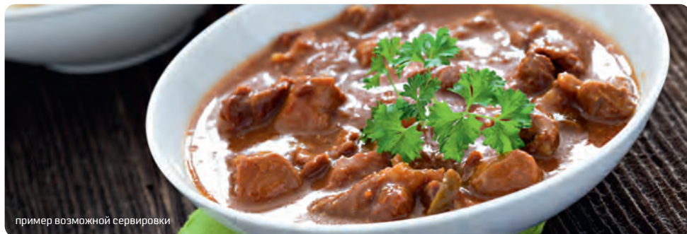
пример возможной сервировки