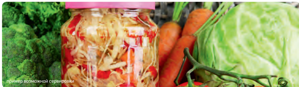
пример возможной сервировки