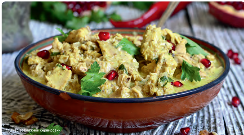
пример возможной сервировки