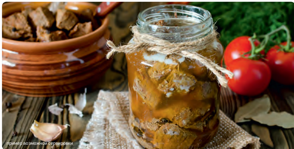
пример возможной сервировки