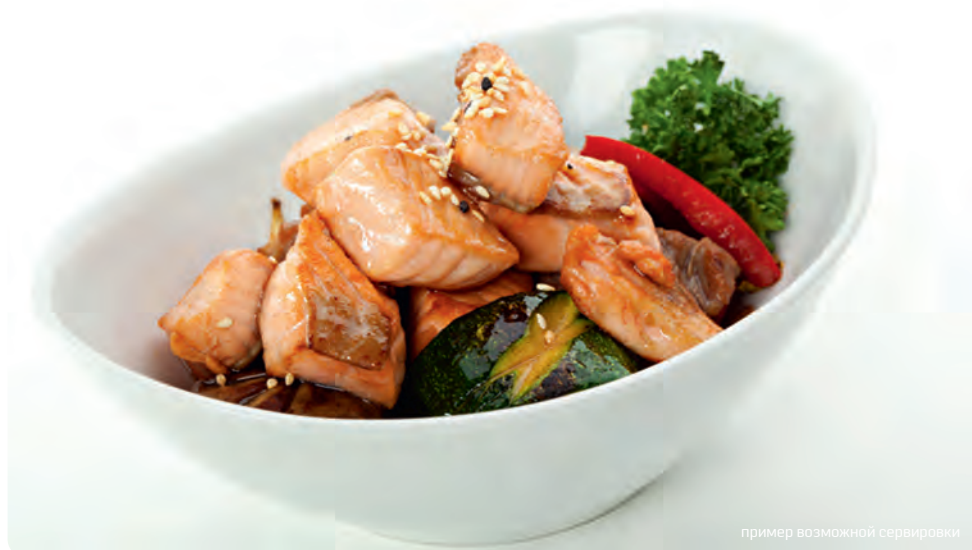
пример возможной сервировки