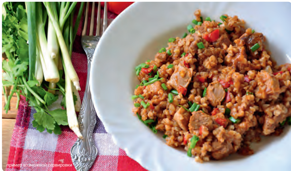
пример возможной сервировки