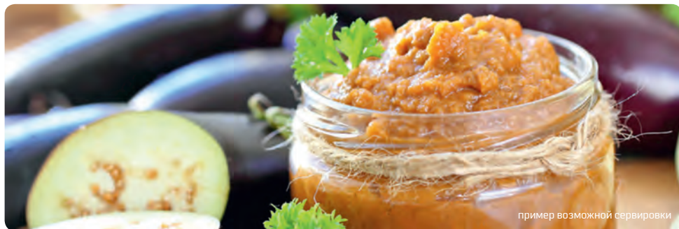
пример возможной сервировки