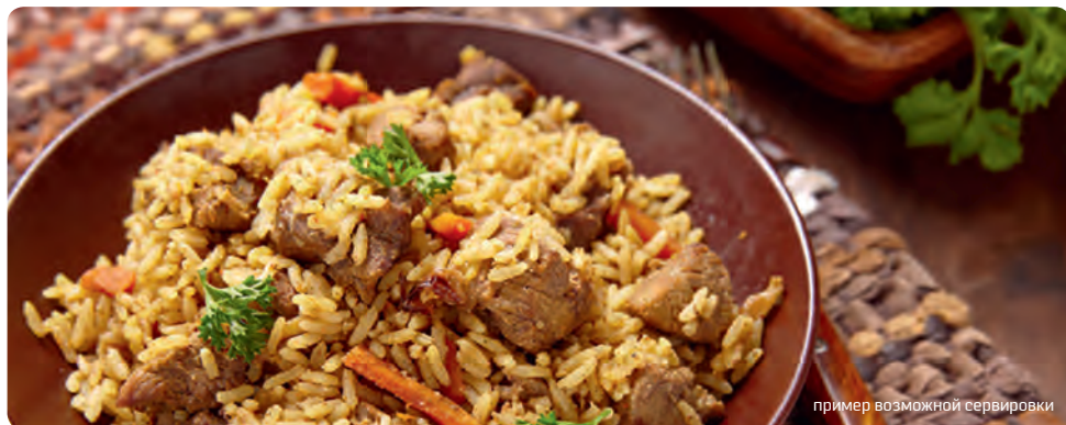
пример возможной сервировки